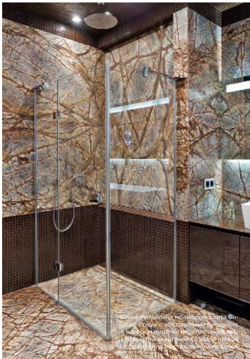
Ванная отделана мрамором сорта бидасар браун с абстрактным рисунком, в котором видятся переплетения ветвей. Этой «картине» создали легкое обрамление из стеклянной мозаики.

друг на друга, а не на мебель и декор». Нельзя сказать, что оттенки стен выбирали специально под искусство. Прежде всего — чтобы были приятны глазу. Однако что комфортно человеку, и для искусства хорошо: яркие работы расцвели на красивом темном фоне