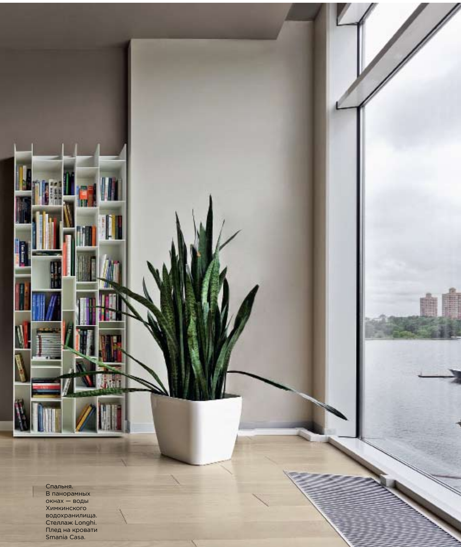
Спальня. В панорамных окнах — воды Химкинского водохранилища. Стеллаж Longhi. Плед на кровати Smania Casa.